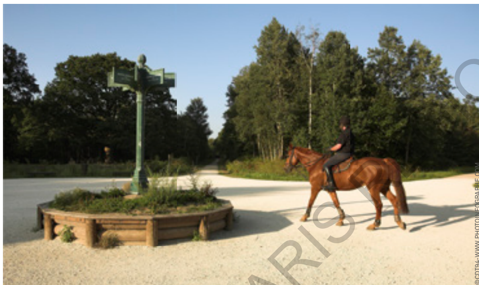
Mettre les spécificités sportives et territoriales au cœur du tourisme, Domaine de Grosbois.

l'industrie touristique, dont on sait les méfaits sur les destinations et leurs populations.